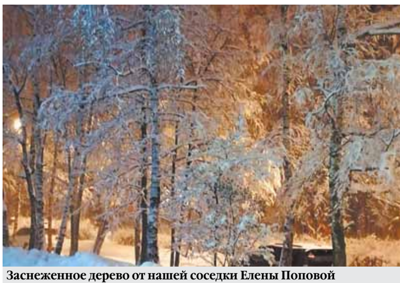
Заснеженное дерево от нашей соседки Елены Поповой