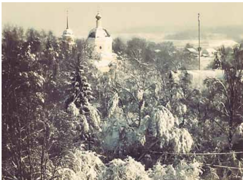
Вид из окна у Анны Зройчиковой