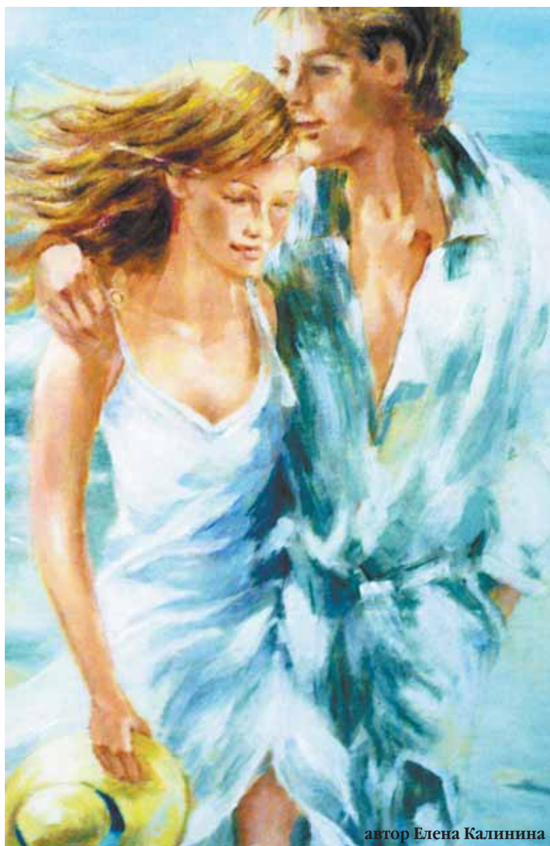
автор Елена Калинина