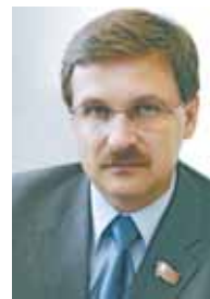
Депутат Московской городской Думы, член фракции «Единая Россия» Иван НОВИЦКИЙ

в денежном эквиваленте будущего России. Дети — наше будущее и от того что и как мы вложим в этот архиважный для нас и будущих поколений вопрос будет зависеть отдача для судьбы России. Это очень ответственно и непросто в выполнении, но мы справимся!