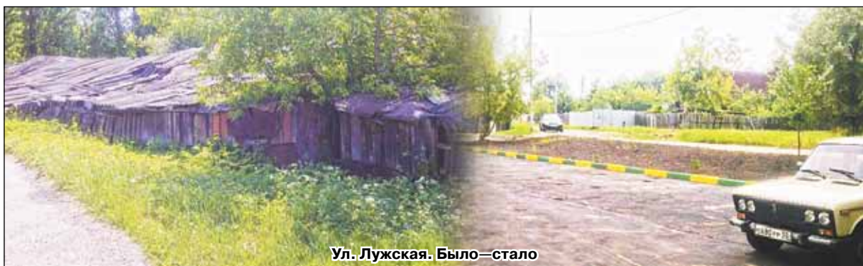
Ул. Лужская. Было—стало