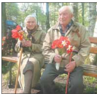
Все почтили память воинов, отдавших свою жизнь, защищая Отечество.

22 июня в Молжаниновском районе состоялось торжественное возложение венков к мемориалу «Ежи» и обелискам, расположенным в населенных пунктах. Участие в акции памяти приняли сотрудники администрации, районных предприятий и жители. Минутой молчания все присутствующие